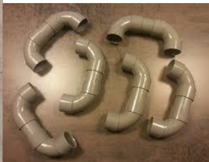
Chuchoteur / Flüsterer