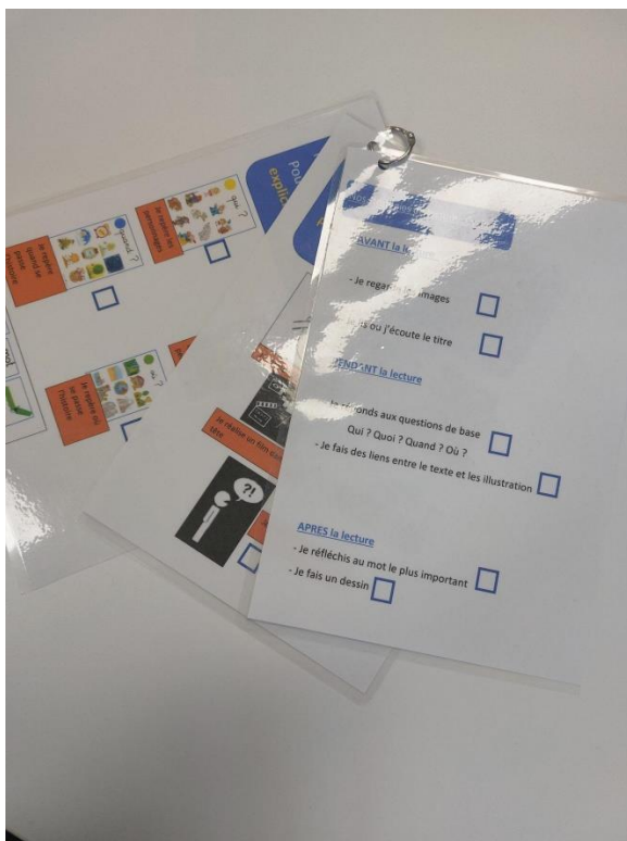
Choix des stratégies de lecture AVANT-pendant et après / Wahl der Lesestrategien VORHER und NACHHER