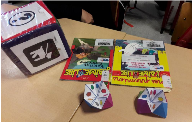
Dé et cocotte de lecture