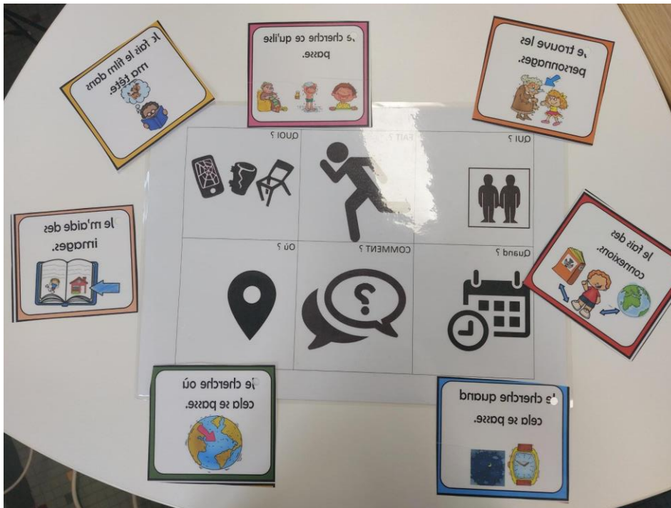
Outils pour les stratégies / Hilfsmittel für Lesestrategien